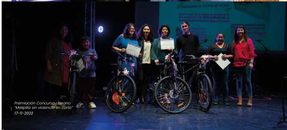
Premiación Concurso Literario "Melipilla sin violencia en corto" 17-11-2022