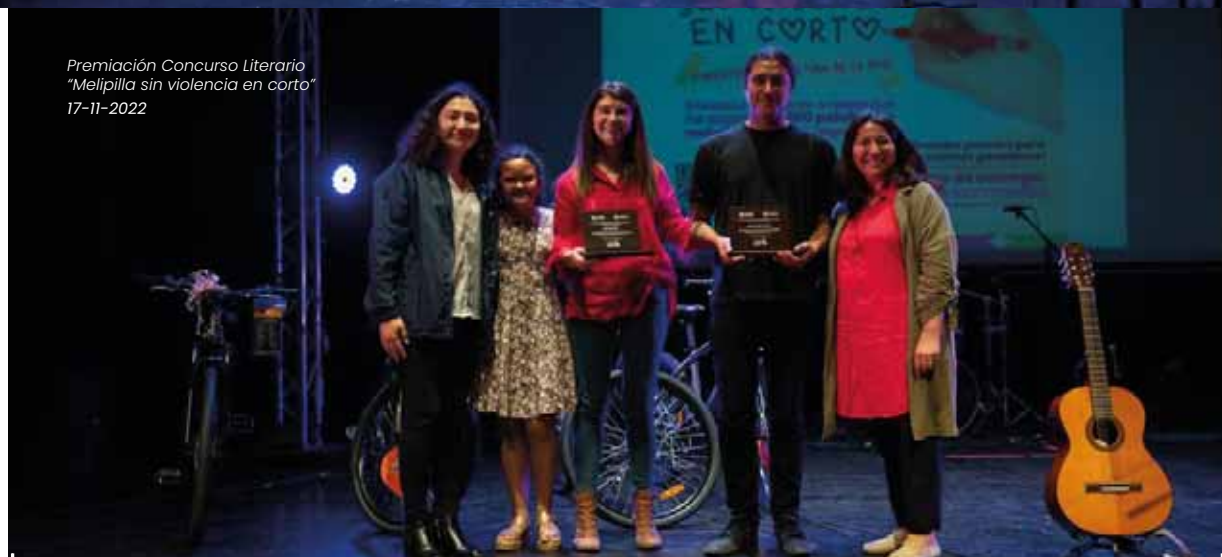
Premiación Concurso Literario "Melipilla sin violencia en corto" 17-11-2022