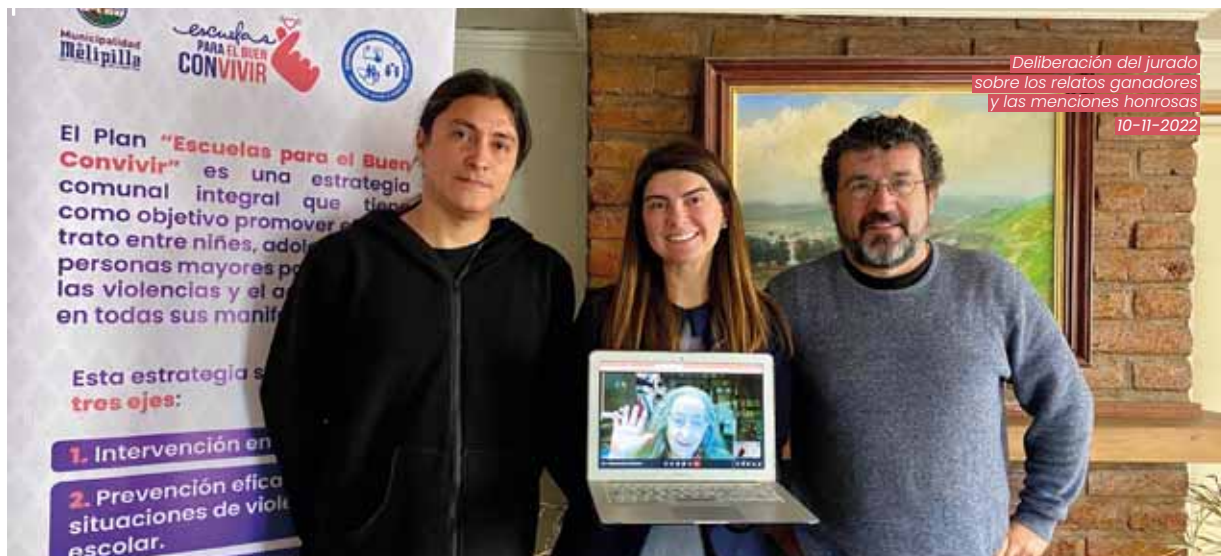
Deliberación del jurado sobre los relatos ganadores y las menciones honoríficas 10-11-2022