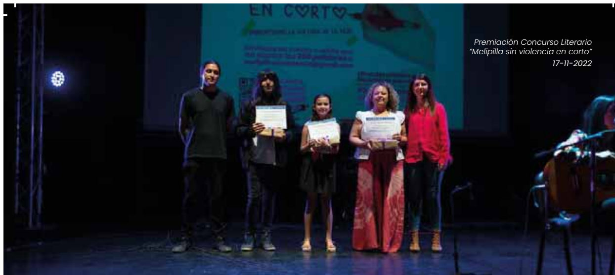
Premiación Concurso Literario "Melipilla sin violencia en corto" 17-11-2022